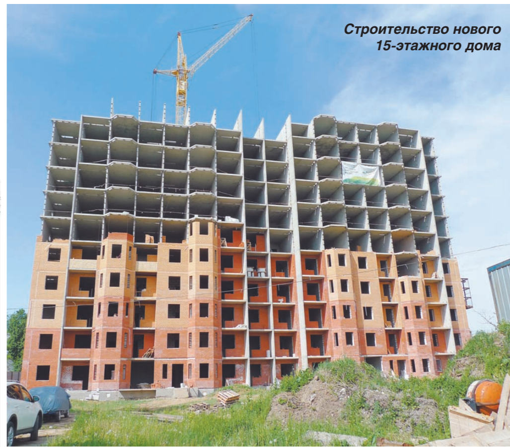
Строительство нового 15-этажного дома

— Сдача дома предполагает наличие отопительных радиаторов, электрической разводки, разводки водопровода и канализации, счётчика воды, охранно-пожарной сигнализации, двойных пластиковых стеклопакетов, выравнивающей бетонной стяжки по плитам перекрытия пола, входной двери, оштукатуренных дверных откосов, оштукатуренных оконных проёмов, подоконников, отливов, застеклённых лоджий. В июле мы начнём строительство следующего пятнадцатизэтажного многоквартирного дома.